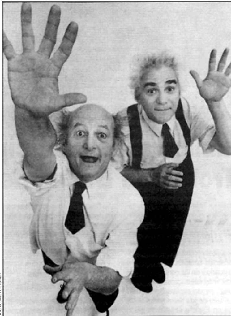
La parella francesa de mims en The Best of... Founambules

Del 3 al 6 de febrer li tocarà el torn a l'obra ¡Qué asco de amor! , de Yolanda García Serrano, amb