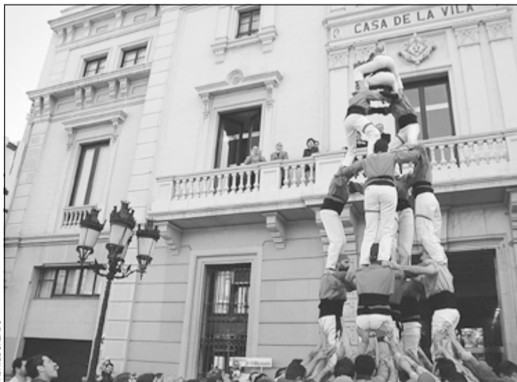
Actuació a la plaça de l'Ajuntament en la diada de la colla

Ara, per acabar la temporada sols els resta una última actuació a Esplugues, el dia 28, en la Trobada de Colles del Baix Llobregat. Mentrestant, i per no perdre la pràctica continuen els assajos al col·legi públic La Marina, situat a la rambla Marina, 408, els dimarts