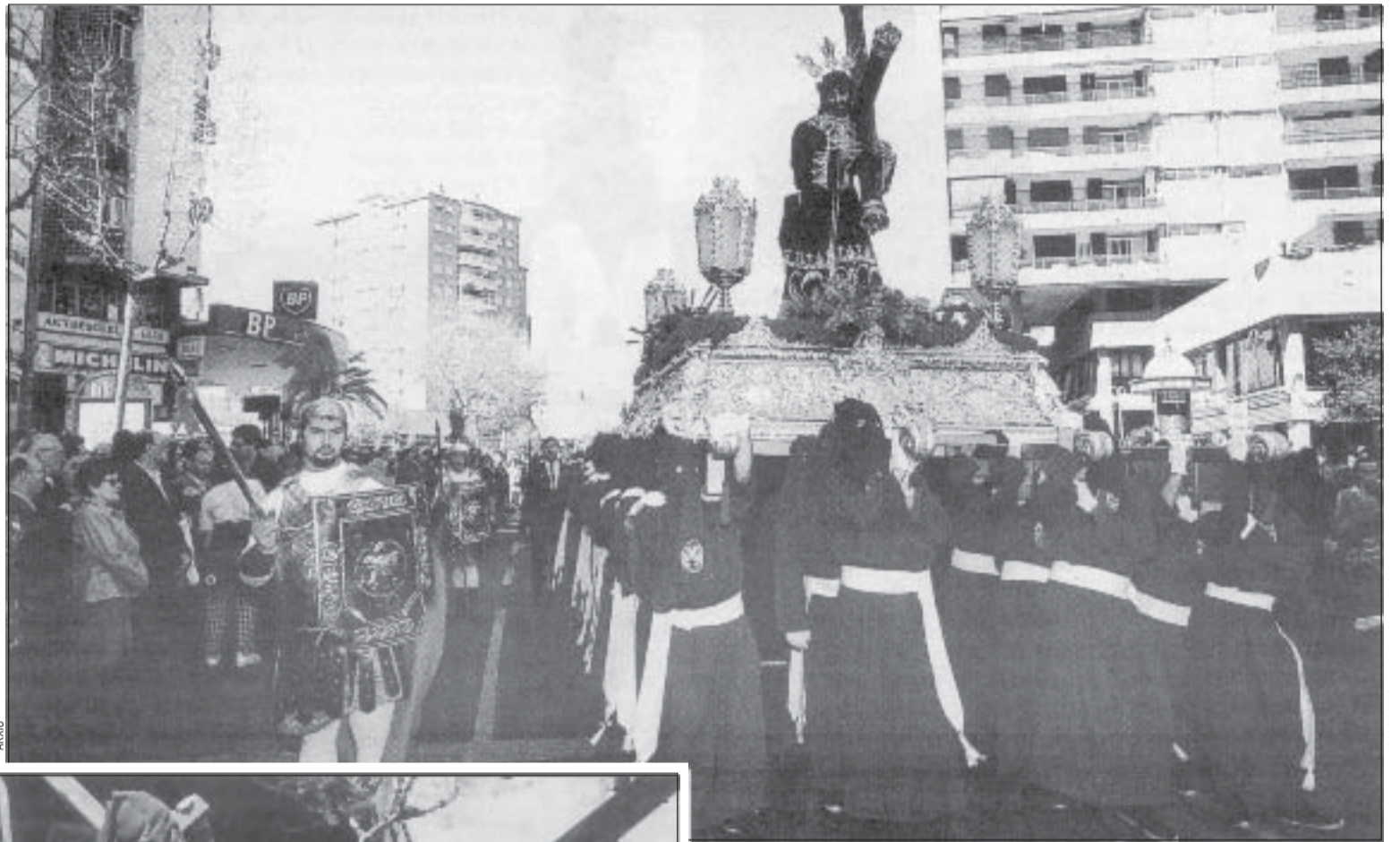
Dos momentos de la procesión de Viernes Santo

Los pasos van acompañados de centuriones, madrinas, penitentes y hermanos mayores, además de la banda de cornetas y tambores. Año tras año, las procesiones de L'Hospitalet cuentan con más