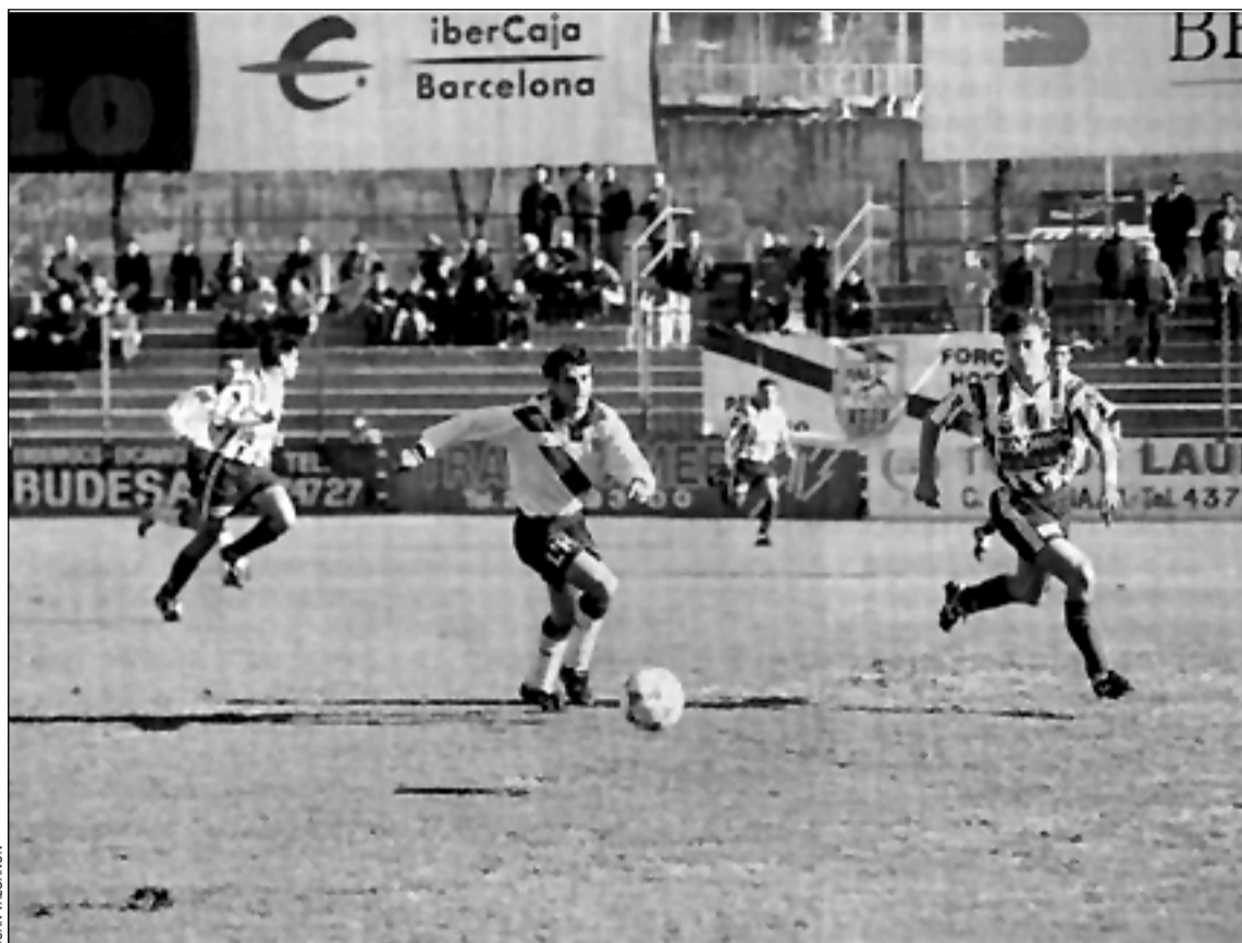
El CE L'Hospitalet empató en casa con el Gandía en el penúltimo partido de la primera vuelta