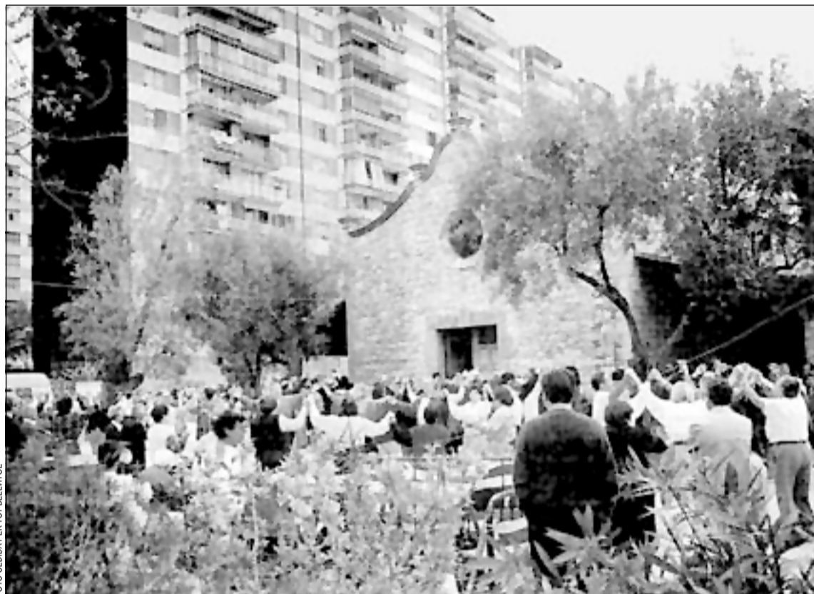
Tot Bellvitge convoca les ballades de sardanes a l'Ermida de Bellvitge

Les persones que vagin a Bellvitge el dia 19 per ajudar a fer realitat aquest somni, no cal que sàpiguen ballar sardanes perquè l'entitat distribuirà sardanistes al llarg de tota la rotllana, els quals ajudaran a seguir als que no en sà-