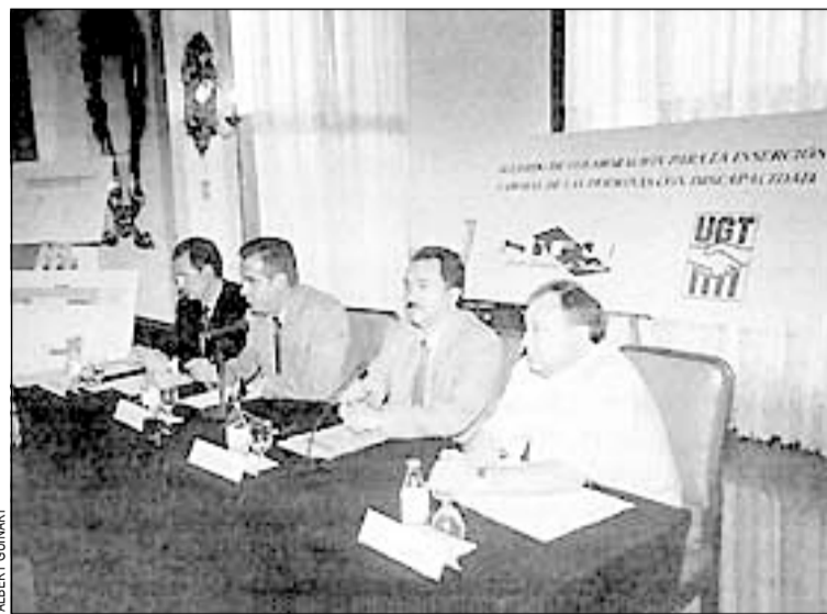
Momento de la firma del convenio en Can Buxeres

Más adelante, esta empresa creará un centro de formación profesional, trasladará sus oficinas a la ciudad y contratará personas discapacitadas hasta llegar a una plantilla de 500 trabajadores.