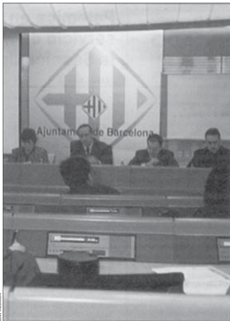
Concejales de los dos ayuntamientos presentaron los proyectos

Gran Via que se extenderá hasta la prolongación de la calle Buenos Aires. Esto permitirá que el tráfico principal se concentre en la calzada central y, al mismo tiempo, hace posible proyectar una futura cobertura de esta calzada desde la calle Escultura hasta Buenos Aires cuando se disponga del presupuesto necesario para ello. Esta operación para cubrir un tramo de Gran Via supone una inversión superior a 1.000 millones de pesetas.