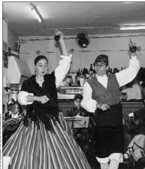
Cante y baile de jotas de la pasada edición