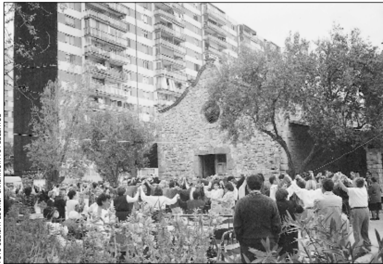
Imatge d'un Aplec de la Sardana a l'Ermida de Bellvitge

L'aplec s'iniciarà a les 11h amb una missa del sardanista i a les 12h començarà la ballada amb la cobla