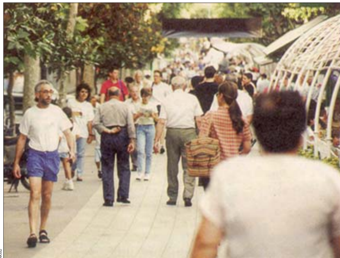
Los ciudadanos consideran que la ciudad ha mejorado y que lo seguirá haciendo

"Me siento satisfecho de vivir en L'Hospitalet". Cada vez son más los ciudadanos que hacen suya esta frase y que se sienten orgullosos de ser hospitalenses. La encuesta sobre Condiciones de vida en L'Hospitalet , que ha realizado la empresa Metra Seis por encargo del Ayuntamiento durante el mes de junio, evidencia este sentimiento de los ciudadanos. Un 87 por ciento de los encuestados afirma sentirse "muy satisfecho" o "bastante satisfecho" de vivir en la ciudad, frente al 85 por ciento que respondía de igual modo en enero de 1995.