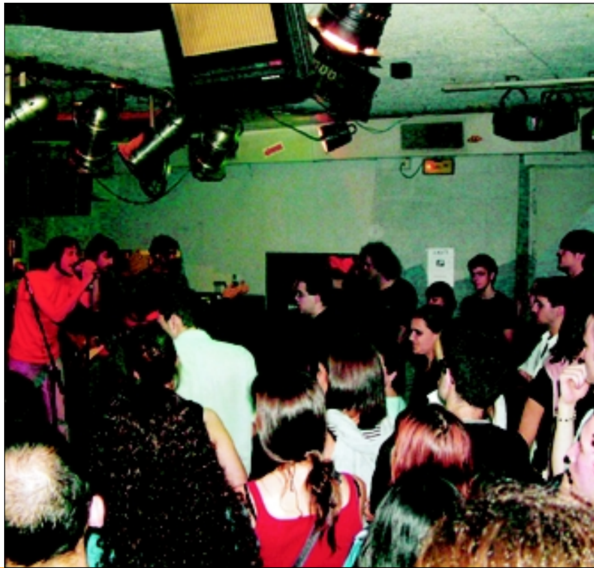
Dos moments de l'edició 2002 del festival de Bad Music