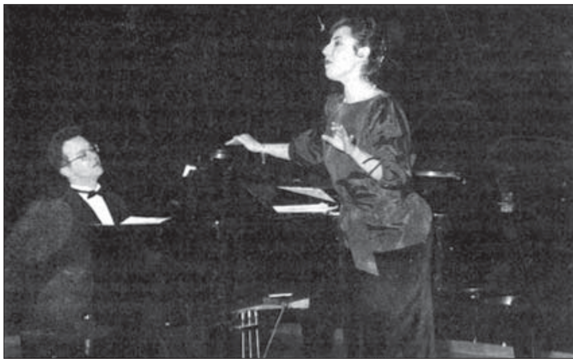
Amics de l'Òpera farà per primera vegada recitals dedicats a Wagner

El título de la obra, Havies de ser tu , hace referencia a la canción It had to be you , de Gus Kahn con música de Isham Jones, que interpreta en varias ocasiones Imma Colomer.