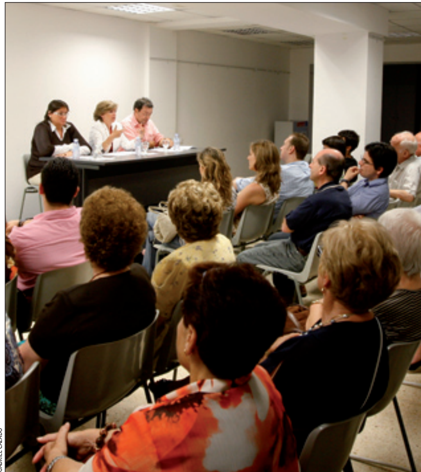
El regidors de CiU explicant les iniciatives dutes a terme

Els regidors de CiU van destacar, entre d'altres dades, que en un any han enviat més de 84.000 papers informatius, han fet 495 precís i preguntes al Ple sobre 151 temes, han