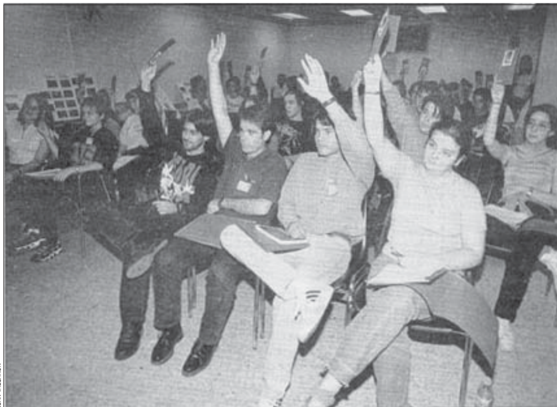
Els socis de l'AEL'H van escollir un nou secretariat a la novena trobada

El nou secretariat serà l'encarregat d'executar el programa de treball del curs 97-98. Es tracta, bàsicament, de consolidar, i en alguns casos reforçar, el que s'ha fet fins ara. La filosofia del programa és la que va marcar des dels seus inicis l'Associació d'Estu-