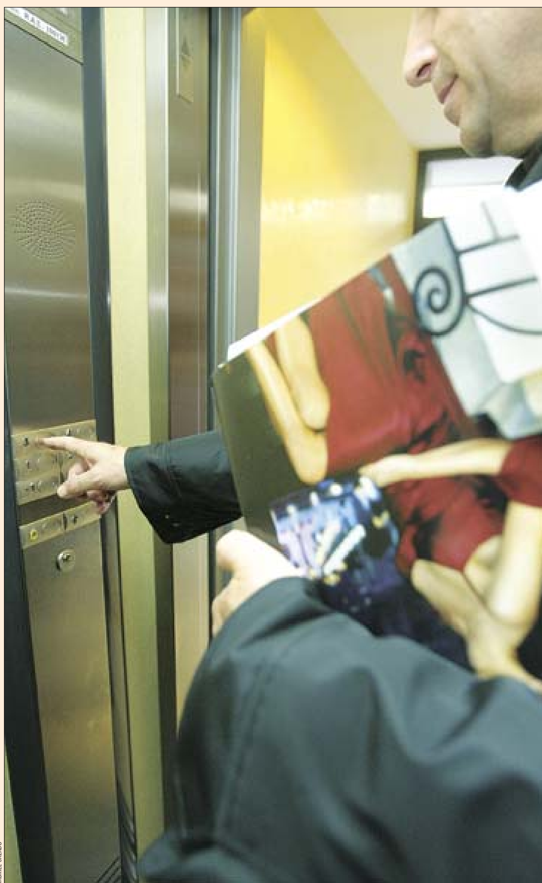
Las ayudas para instalar ascensores es uno de los programas más activos

El programa de ayudas para instalar ascensores en las fincas antiguas es uno de los ejes de los planes integrales que se desarrollan en la zona norte de la ciudad para mejorar la calidad de vida en estos barrios, aunque también se tramitan peticiones que lleguen de otras zonas de la ciudad. Por ese motivo se abrió al público una oficina especializada en la plaza Espanyola que funciona a pleno rendimiento desde marzo y que estuvo de forma provisional en la antigua concejalía durante 2002.