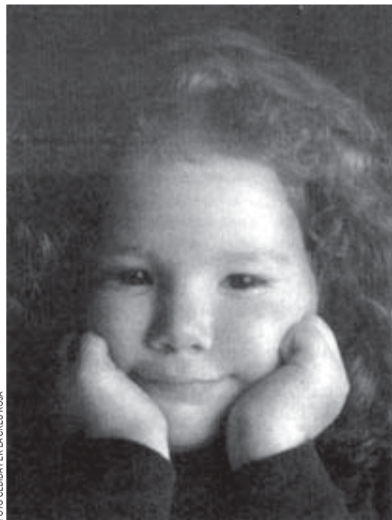
Aquesta fotografia il·lustra la campanya de reis