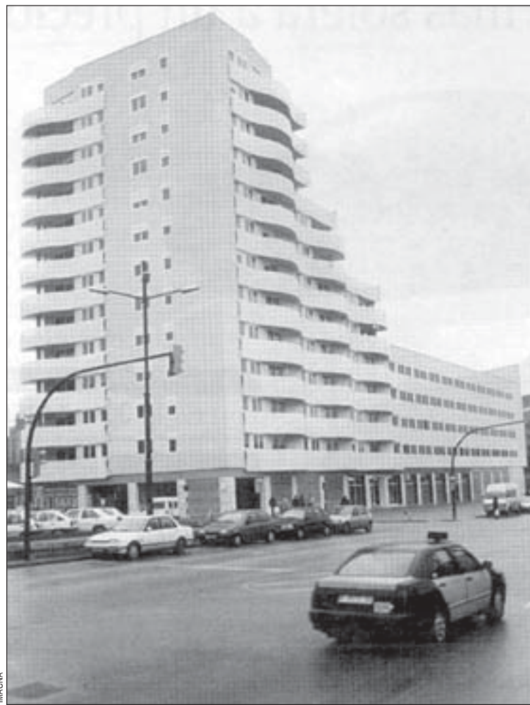
La iniciativa privada ha construido viviendas en la zona