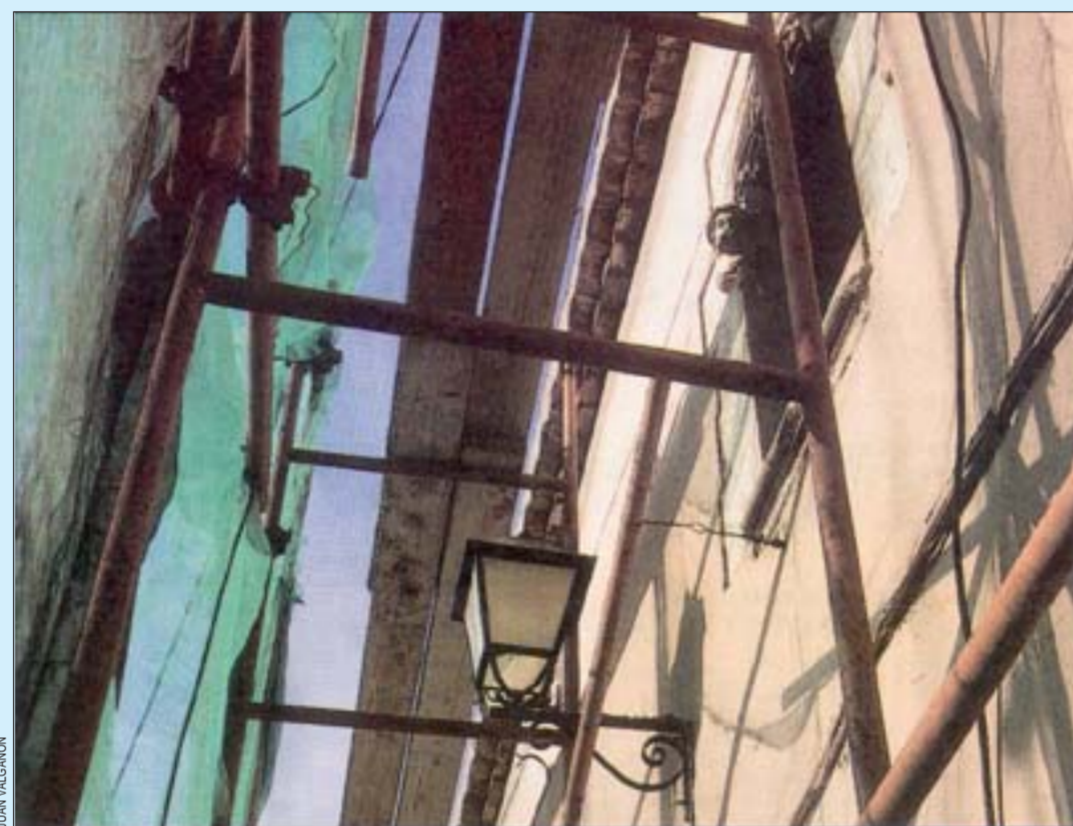
La Casa dels Finestralls Gòtics aborda la primera fase de su rehabilitación