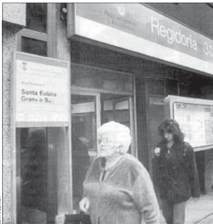
La nueva concejalía contará con un servicio de recaudación

Por lo que respecta al centro sociocultural, éste será un equipamiento de nuevo cuño en San-