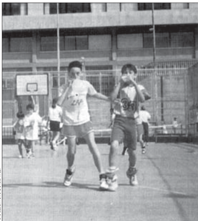
Un aspecto de la fiesta de promoción de la AE L'H de 1994

La Associació Esportiva Centre Sanfeliu organitzarà el pròxim sàbado 20 de mayo, en la plaza dels Cirerers, su Diada de l'Esport 95. Durante toda esa tarde, los jóve-