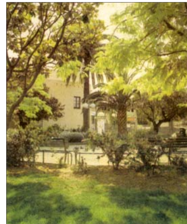
Imagen de los jardines de Santa Eulàlia 2

dos zonas se sitúa el distrito quinto, Can Serra y Pubilla Casas, con algo más de 73.000 metros cuadrados. Por el contrario, el distrito con menos zona verde es el segundo, Collblanc-La Torrassa (17.404 metros cuadrados). Precisamente este distrito es el que posee una mayor densidad urbana.