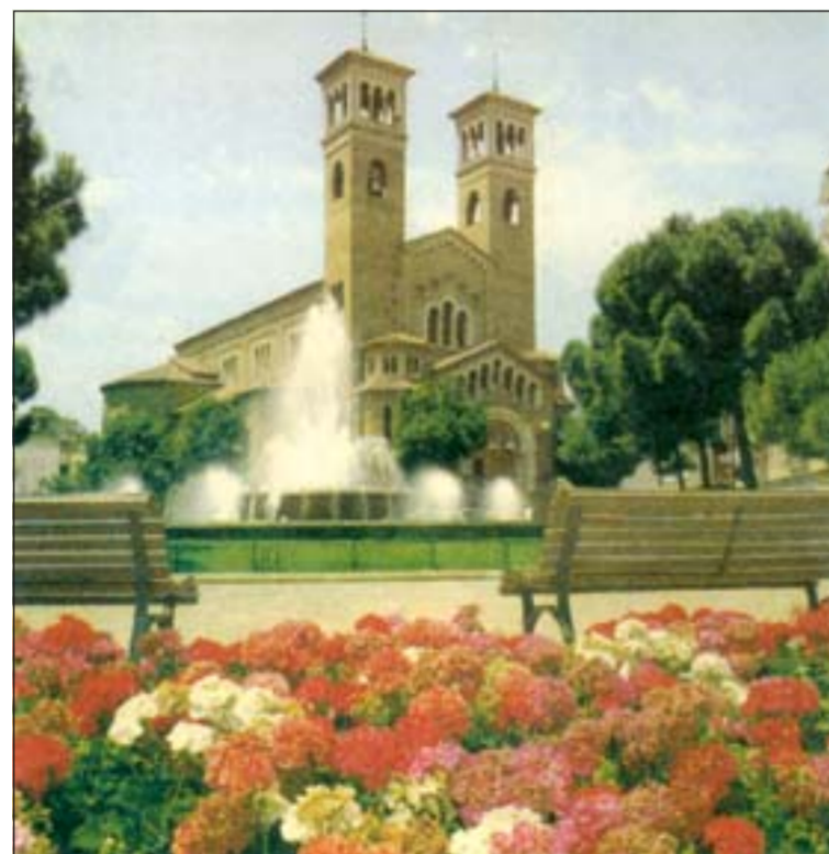
La ciudad florece en primavera

A estas cifras se han de sumar otros espacios también considera-