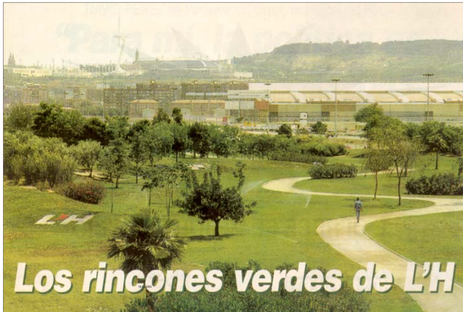
El sector Pedrosa es uno de los espacios abiertos que L'Hospitalet ha ganado en los últimos años