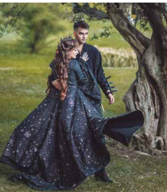
EL COSTURERO REAL

han instal·lat i comencen a transformar l'economia i els espais urbans, ahora que incideixen en la vida social del municipi