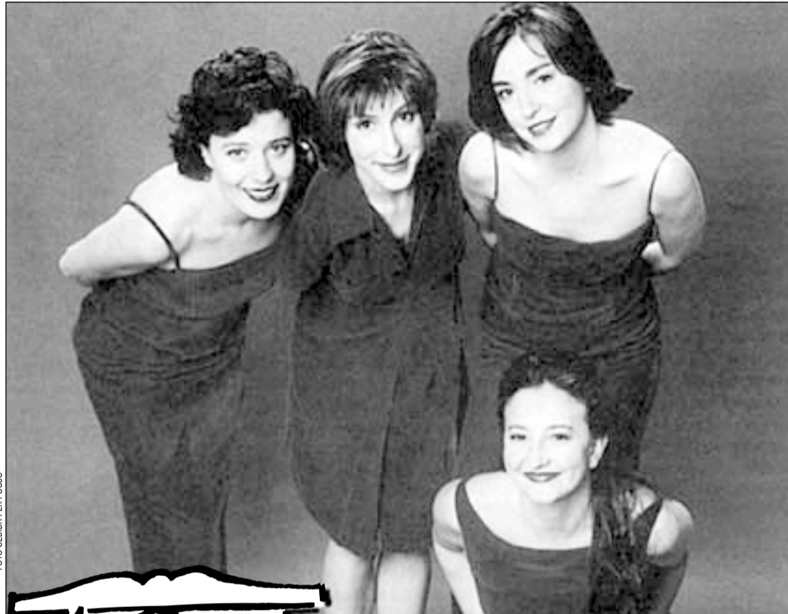
Una part dels protagonistes de Criatures , de T de Teatre

D'altra banda, del 22 al 24, coincidint de ple amb la celebració de les Festes de Primavera, es presentarà l'espectacle Criatures , de la companyia T de Teatre, dirigida per David Plana, interpretada per quatre joves actrius i amb textos de Sergi Belbel, Paco Mir, Jordi