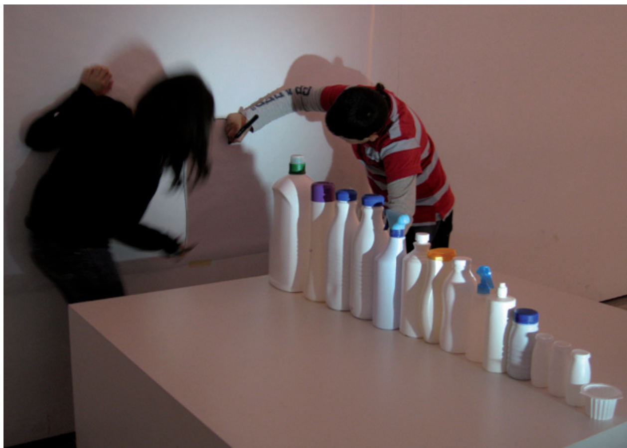
Activitat d'escolars al Centre d'Art Tecla Sala

La primera activitat serà el pròxim 28 de setembre, quan es presentarà el conjunt de la programació i es realitzarà una visita guiada a l'exposició El geni de les coses , que obre la temporada artística. Pel que fa als tallers, que consisteixen a fer un exercici pràctic per apropar el públic als processos de creació, enguany n'hi ha dos de nous. D'una banda, El cos parla , adreçat a estudiants, on es treballarà el dibuix i