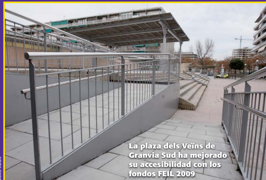
La plaza dels Veïns de Granvia Sud ha mejorado su accesibilidad con los fondos FEIL 2009

La alcaldesa también expuso ante sindicatos y empresarios el balance de la ejecución del fondo estatal durante 2009. Los 145 proyectos ejecutados, con una inversión de 44,5 millones de euros, dieron trabajo a 3.126 personas, de las que 920 provenían del paro. Las intervenciones realizadas permitieron reordenar más de 100 calles y diferentes espacios públicos. En total se actuó sobre 85.700 m 2 de calzada y 89.300 m 2 de aceras. Se mejoraron 23 centros escolares, 13 instalaciones deportivas, 6 casals d'avis y 11 equipamientos culturales y sedes de entidades.