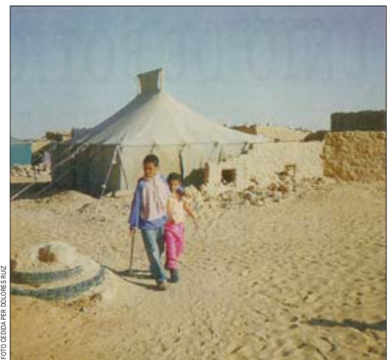
Nicaragua y los refugiados saharauis de Argelia reciben una parte importante de la ayuda hospitalense