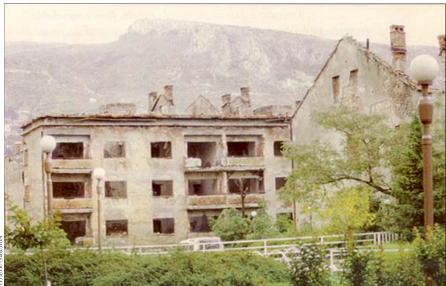
Seis proyectos de cooperación se destinarán a la reconstrucción de Bosnia, arrasado por la guerra

Las últimas subvenciones aprobadas han llegado a tres continentes: el europeo, con la mirada puesta en Bosnia; África, con proyectos en Costa de Marfil, Marruecos y el Sáhara, y América, para Nicaragua, Cuba y Brasil.