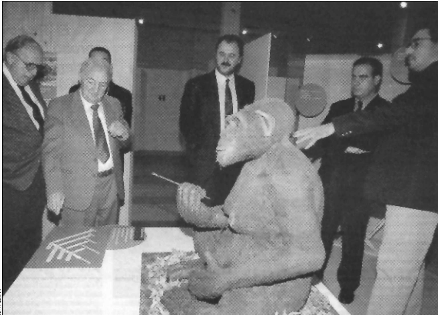
Moment de la inauguració de l'exposició El primat humà organitzada pel Museu de L'Hospitalet, amb Joan Oró (segon per l'esquerra)

Tanmateix, a la Casa Espanya i també des del dia 12 i fins el 28 de març, s'estan realitzant uns tallers teòrics de Prehistòria i d' Evolució humana , la primera part dels quals compren una visita a la sala Cirici i la segona, una descoberta de coses tan normals als nostres dies com saber de quina manera feien foc els nostres avantpassats, com teixien els vestits o amb quines eines caçaven. També s'explica la teoria de Darwin i l'evolució de les espècies, l' homo habilis , l' homo erectus , el Neanderthal, l' homo sapiens o per què l'Àfrica ha estat el bressol de la vida humana.