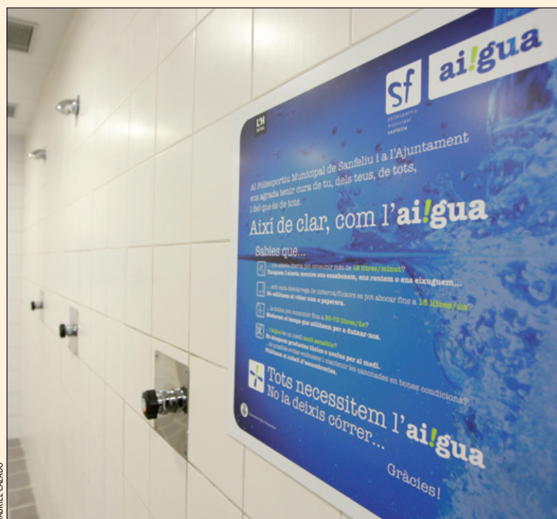
Indicaciones sobre el consumo de agua

Con la puesta en marcha de la zona de agua, el Polideportivo Municipal de Sanfeliu ha elaborado el llamado Manual del agua con el objetivo de reducir su consumo, tanto en el funcionamiento de la instalación como en el uso que hacen los abonados. La idea