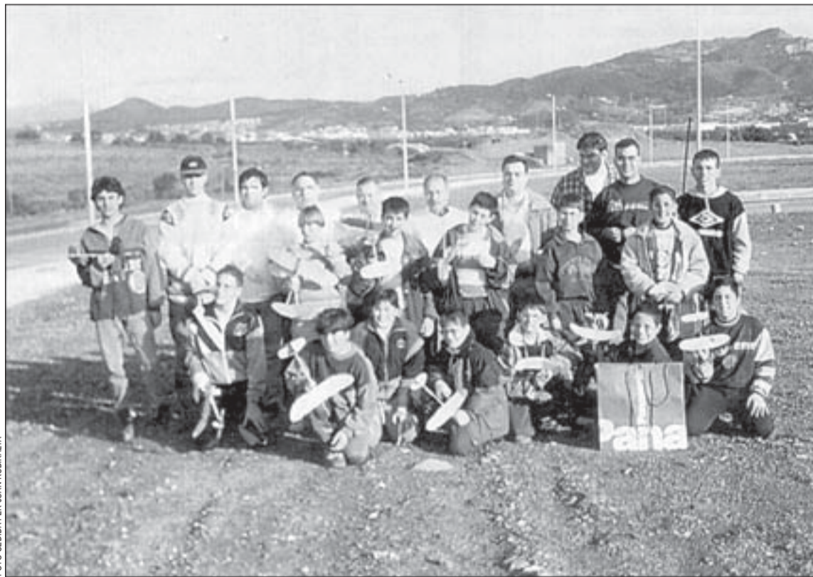
El Club de Aerodelismo Delta està integrat majoritàriament per joves del CP Pau Esteve