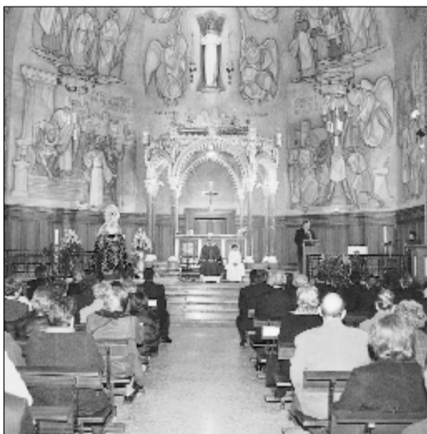
Misa de besamanos de la Cofradía 15+1