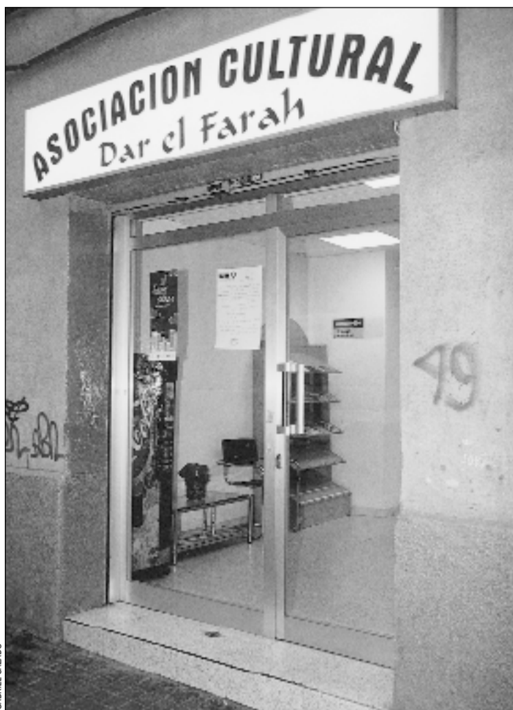
La sede de Dar el Farah se encuentra en Pubilla Casas

Dar el Farah tiene su local en la calle Mestre Serrano, 15.