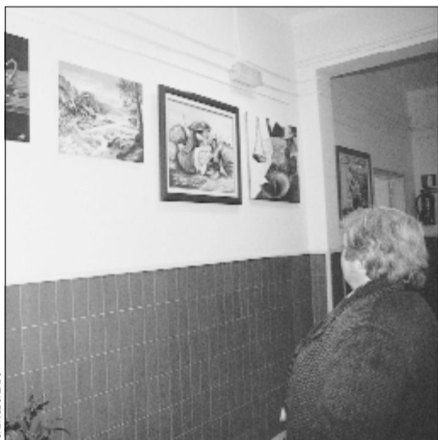
Exposición en la Concejalía de los distritos IV y V