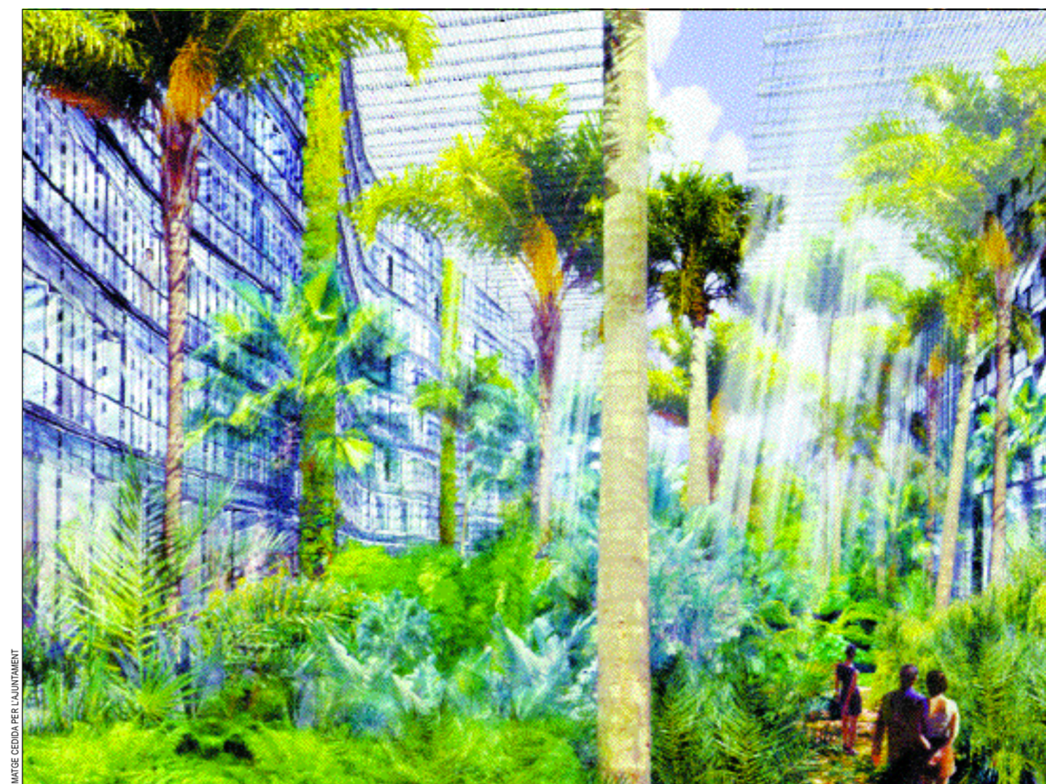
Reproducción del frondoso jardín interior en torno al que se construirán los edificios de la City Metropolitana