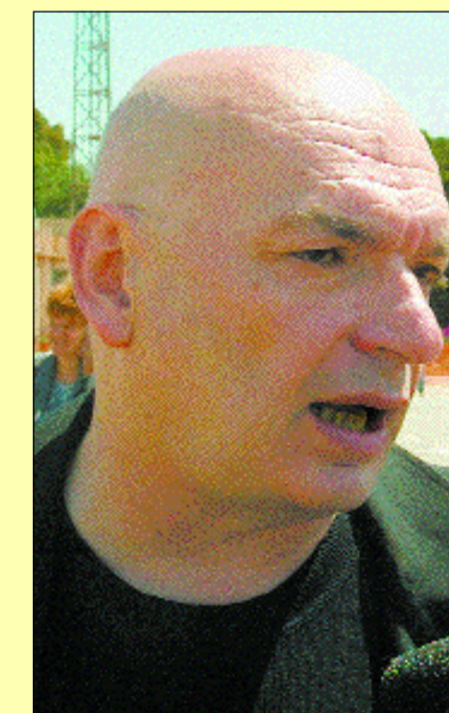
Nouvel presentó el proyecto en 2001

El jardín aparece como un auténtico oasis en un complejo dedicado a los negocios, mientras que la cúpula acristalada del