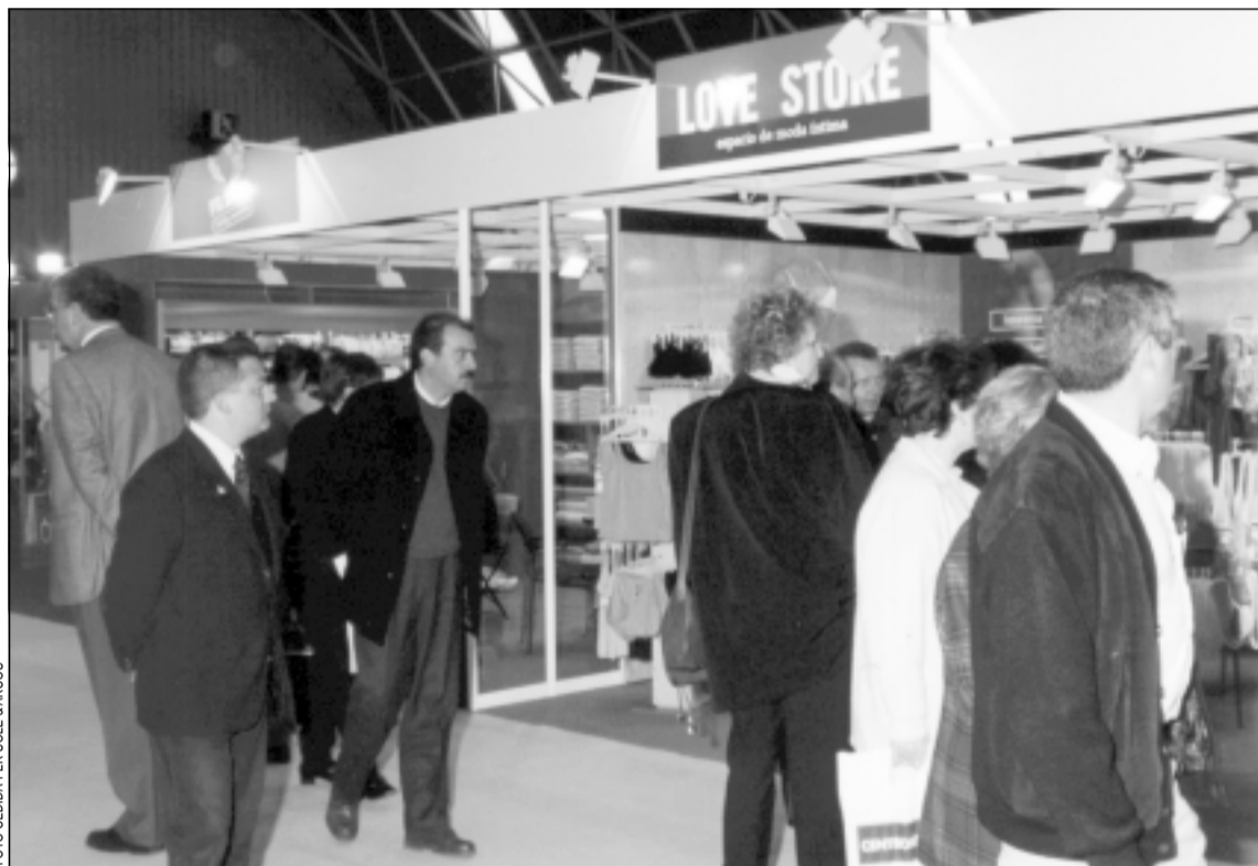
Les anteriors edicions de BCN Franquícia havien tingut com a escenari Barcelona

La sisena edició de BCN Franquícia obrirà les seves portes a La Farga del 2 al 4 de juny. La fira ocuparà 4.000 metres quadrats del recinte per mostrar l'oferta més variada del sector de la franquícia. Una gran part dels expositors provenen de fora de Catalunya i volen donar-se a conèixer per obrir centres franquiciats