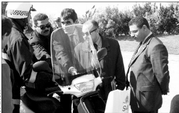
La delegació mira les motos de la Guàrdia Urbana

tats", va dir en l'acte d'investidura. L'Acadèmia de Tastavins de Sant Humbert té 340 acadèmics, 80 de Mèrit i 90 d'Honor. El Divinum , aplega activitats relacionades amb el vi, degustacions, concursos i Les Rutes del Vi i el Cava. # M. S.