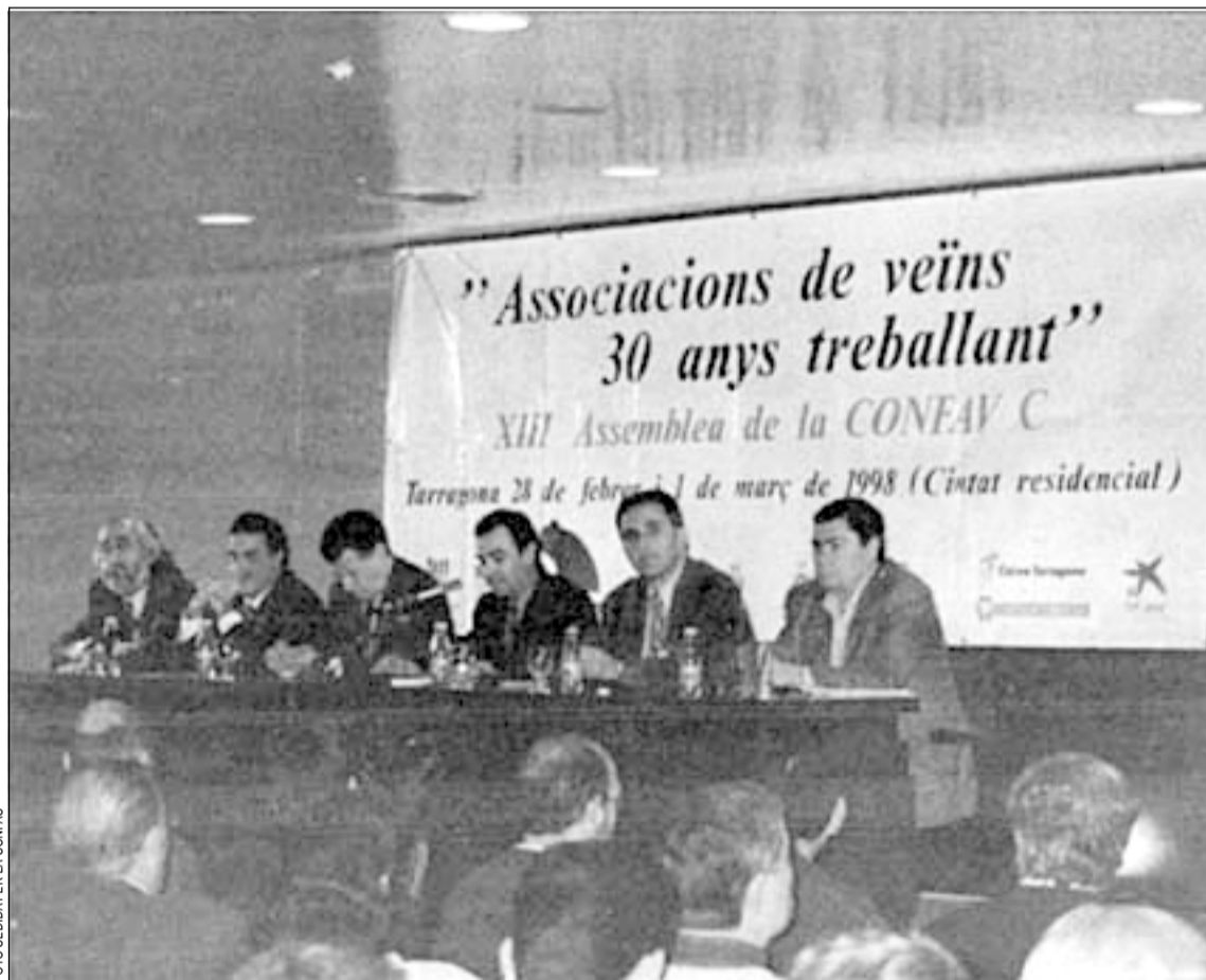
Imagen de la XIII asamblea de la CONFAVC que tuvo lugar en Tarragona en marzo del pasado año

Los días 7, 8 y 9 de mayo, el recinto ferial de La Farga acogerá la XII Asamblea General de la Confederación de Asociaciones de Vecinos del Estado Español (CAVE). Cerca de 300 delegados debatirán durante estos tres días sobre el presente y el futuro del movimiento vecinal, aprobarán los informes de gestión y económico, y discutirán una polémica propuesta de cambio de estatutos y reglamentos