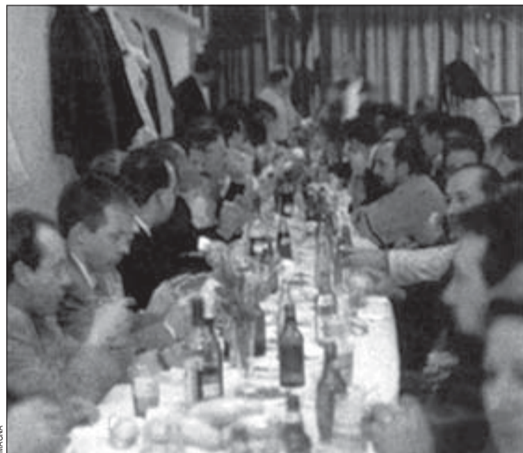
Pubilla Casas cerró el año festivo con una cena