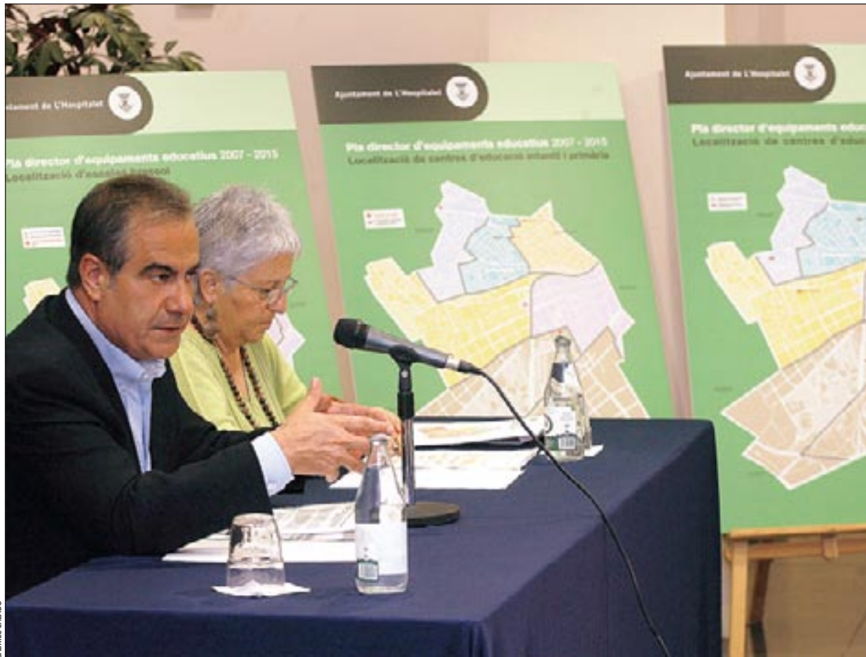
Corbacho i Company presenten els eixos del Pla director d'equipaments educatius

Pel que fa a la secundària obligatòria, les necessitats educatives