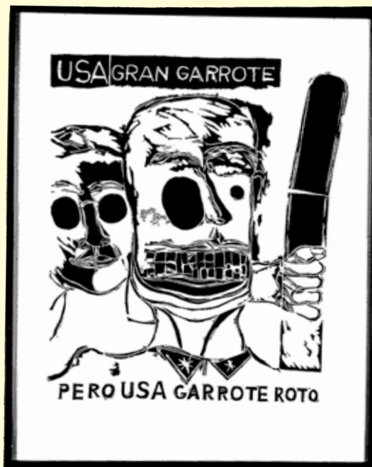
'Sense títol', 1965, de Guinovart