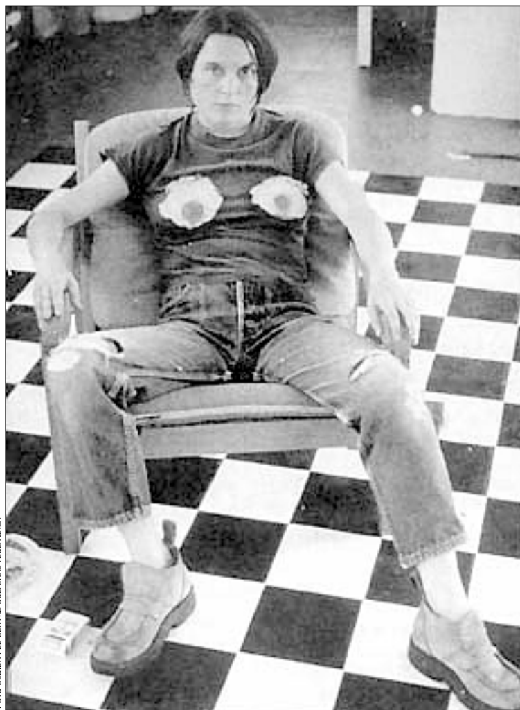
Autoretrat amb ous ferrats de Sarah Lucas

Sarah Lucas viu a Londres i és considerada una de les 'noies dolentes' del jove art britànic. En la majoria de les seves obres juga amb un arquetip de dona andrògina que li agrada adoptar postures masculines sense deixar de ser atractiva i s'introdueix, sense por, en el terreny del sexe i la mort.