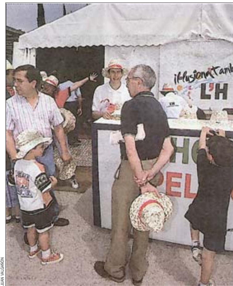
La carpa Il·lusiona't recorre la mayoría de los barrios en fiesta

En el centro de la carpa se ha habilitado un pequeño auditorio con unas curiosas butacas que recrean las iniciales de L'Hospitalet. En este espacio se proyecta un vídeo de 4 minutos que lleva por título Una ciutat per mirar-la, viure-la i escoltar-la , una nueva oportunidad de detenerse para contemplar con detalle las imágenes, la actividad y los sonidos que nos rodean. Esta proyección se estrenó en la pasada edición de los Premios Ciutat de L'Hospitalet y ahora se muestra a toda la ciudad.