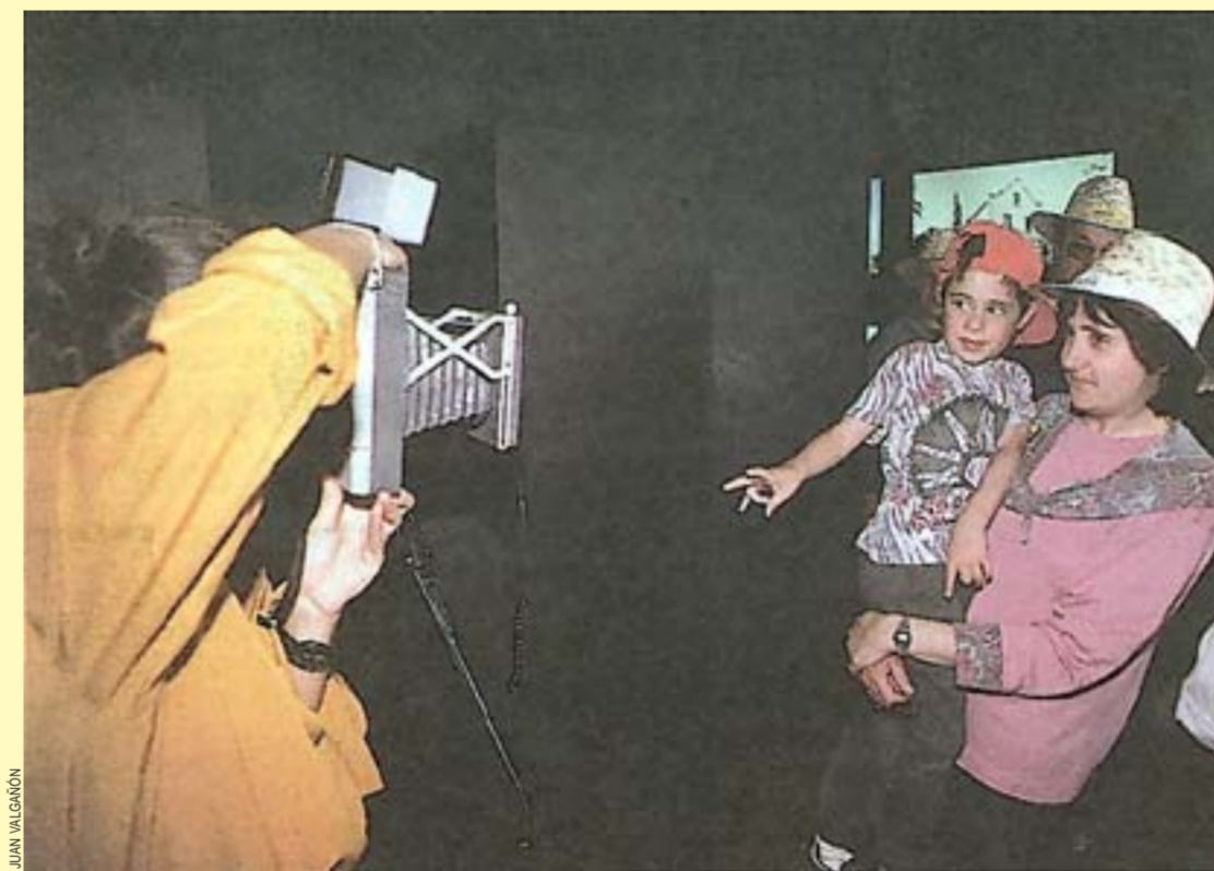
Los visitantes de la carpa Il·lusiona't pueden incluir su fotografía en el logotipo L'H