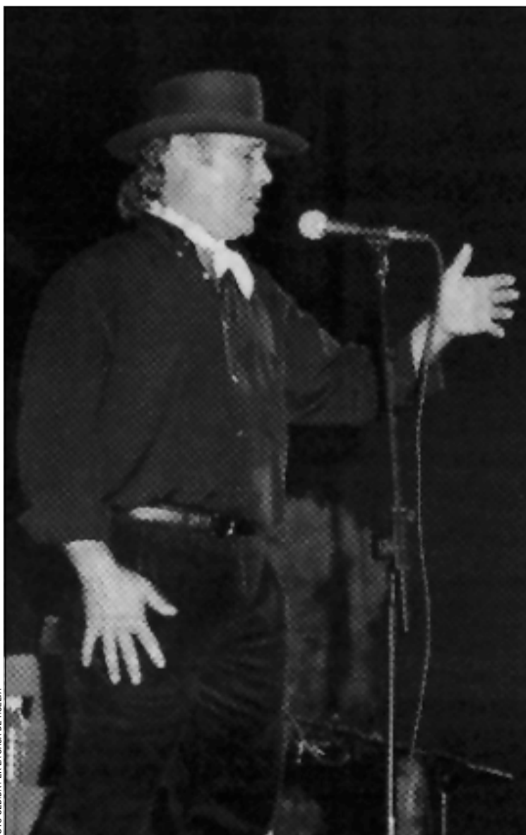
El Cabrero será la figura estelar en el polideportivo de Bellvitge

La junta directiva del Centro Andaluz Casa de Huelva espera que en esta décima edición del Festival de Fandangos el polideportivo Sergio Manzano de Bellvitge alcance el lleno absoluto con la asistencia de 1.500 personas. La puesta en escena será otra novedad de este festival, que es el más importante de los cinco que organiza la entidad a lo largo del año. "Invito a todos los hospitalenses a pasar cinco horas con los mejores fandangos de Huelva", señala entusiasmado el presidente.