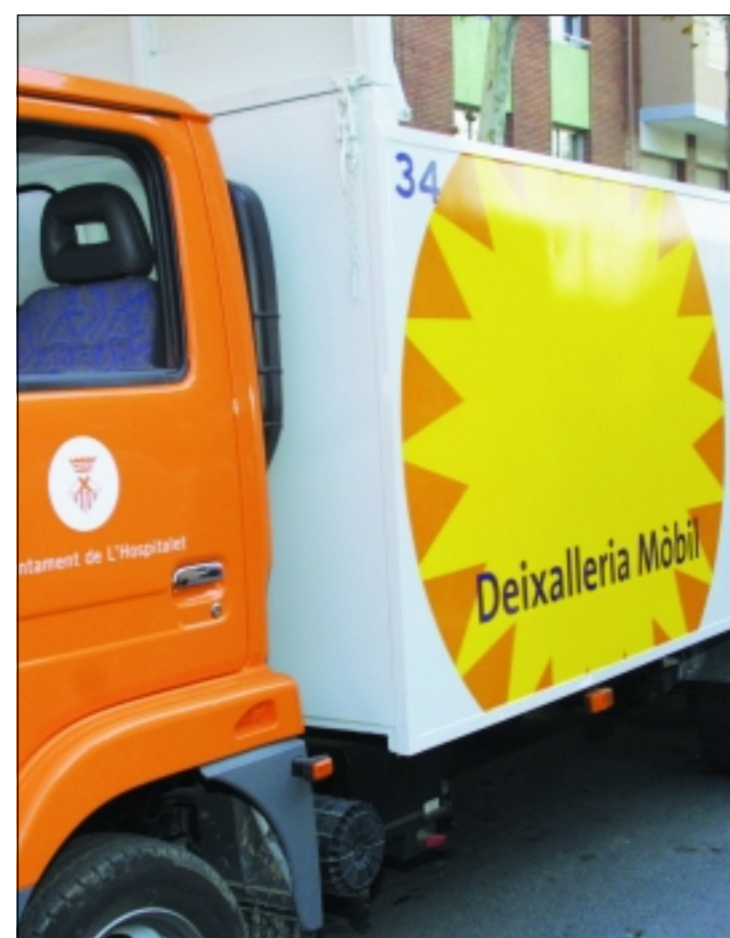
Una de las 'deixallerias' móviles que recorrerán los barrios. Los nuevos camiones de recogida de muebles compactan la madera

Más eficaz, menos contaminante y más sostenible