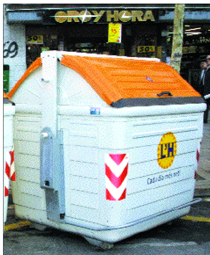
Los contenedores tendrán un espacio para materia orgánica. Este vehículo recicla el agua para limpiar el alcantarillado