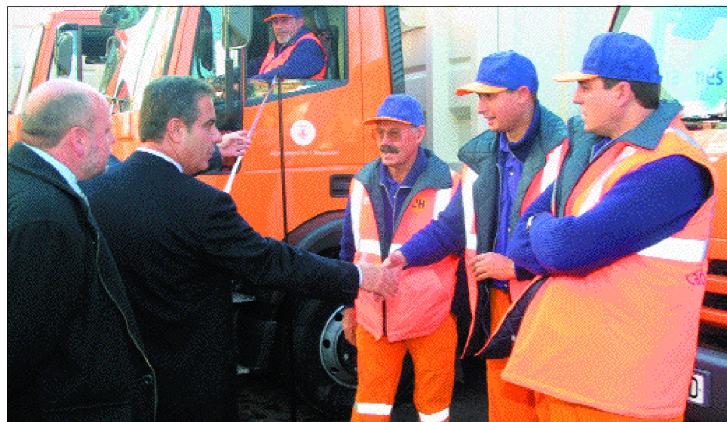
El alcalde Corbacho saluda al personal del servicio de limpieza en el acto de presentación que tuvo lugar en la avenida Masnou

L'Hospitalet acaba de estrenar la nueva contrata de limpieza y recogida de residuos que incorpora importantes novedades con el objetivo de mejorar su eficacia y contribuir al mantenimiento de nuestro medio ambiente. La nueva contrata, que se irá implantando en diversas fases, introduce la recogida de residuos orgánicos, pone en marcha desecherías móviles y disminuye la emisión de gases y ruidos con el último equipamiento técnico, más eficaz y menos contaminante.