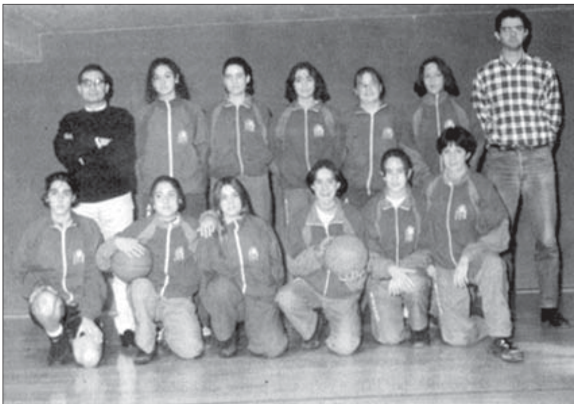
IMAGINA L'equip cadet femení de l'Associació Esportiva Centre-Sanfeliu

El sistema de competició serà en forma de lliga durant la primera fase, quan els equips seran dividits en quatre grups a cadascuna de les dues competicions. Les semifinals i finals seran a partit únic. La primera fase es disputarà els dies 28 i 29, en sessions de matí i tar-