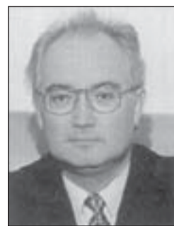
Manuel Mas i Estela President de la FMC

La principal funció de la Federació de Municipis de Catalunya (FMC) és representar i defensar el conjunt de les entitats locals davant altres institucions i entitats públiques o privades. És en aquest context que la FMC analitza totes les normes i actuacions de les altres administracions que afecten el món local (lleis, decrets, plans, etc) i procura defensar les competències municipals, ja sigui negociant o acudint als tribunals. I aquesta defensa no es fa per un simple interès corporatiu. És fa per assegurar els mitjans suficients per a un bon govern de les ciutats i pobles, per a poder donar cada dia millors serveis als ciutadans.