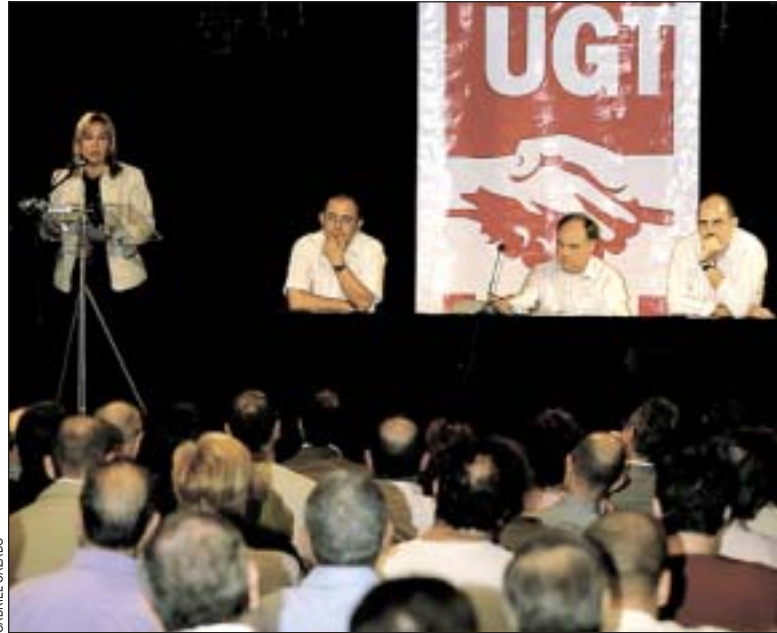
La convocatòria va tenir una gran participació