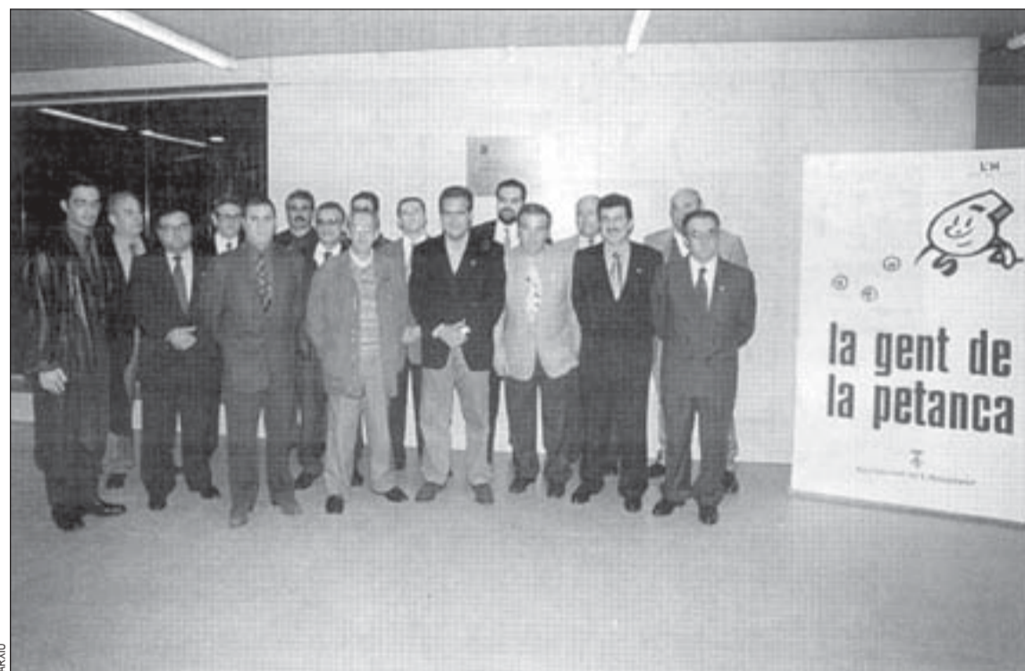
La família de la petanca de la ciutat va celebrar la seva festa al Poliesportiu de Bellvitge

El futbol sala és l'esport que més ha cridat l'atenció entre els joves dels centres d'educació secundària que s'han inscrit per participar en aquesta nova edició de la Diada de l'Esport. Un total de 19 equips, dividits en tres grups, s'enfronten tots els divendres a la tarda, des del 31 de gener, a les pistes del Mercè Rodoreda i del Mare de Déu de Bellvitge.