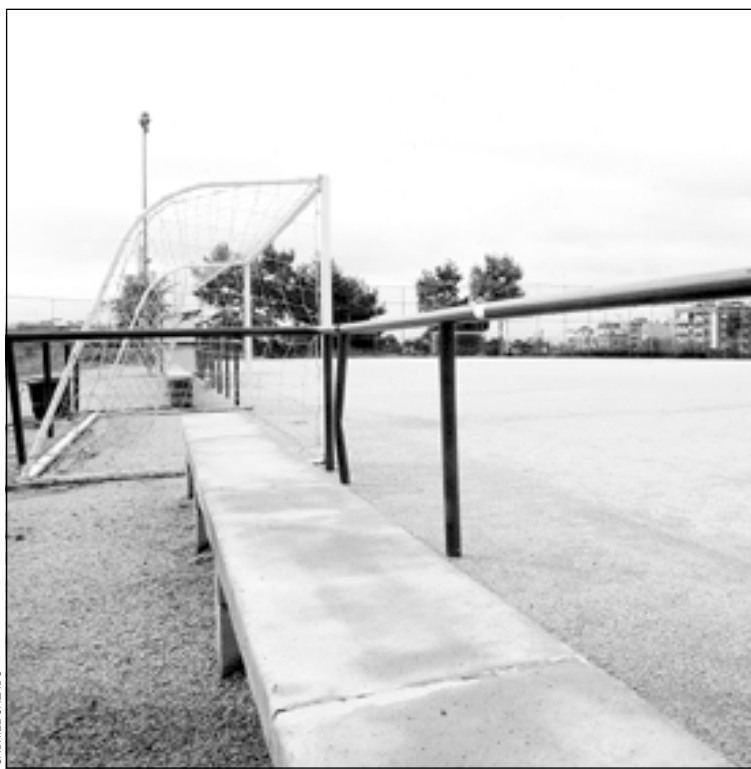
En Can Buxeres se construirá un campo A-7

En paralelo, el proyecto contempla la ampliación del Campo de Fútbol de Can Buxeres con la creación de un campo de fútbol A-7, la ampliación de los vestuarios, 4 para los jugadores y 2 para árbitros, y oficinas para el club del barrio que entrarán en funcionamiento en mayo de