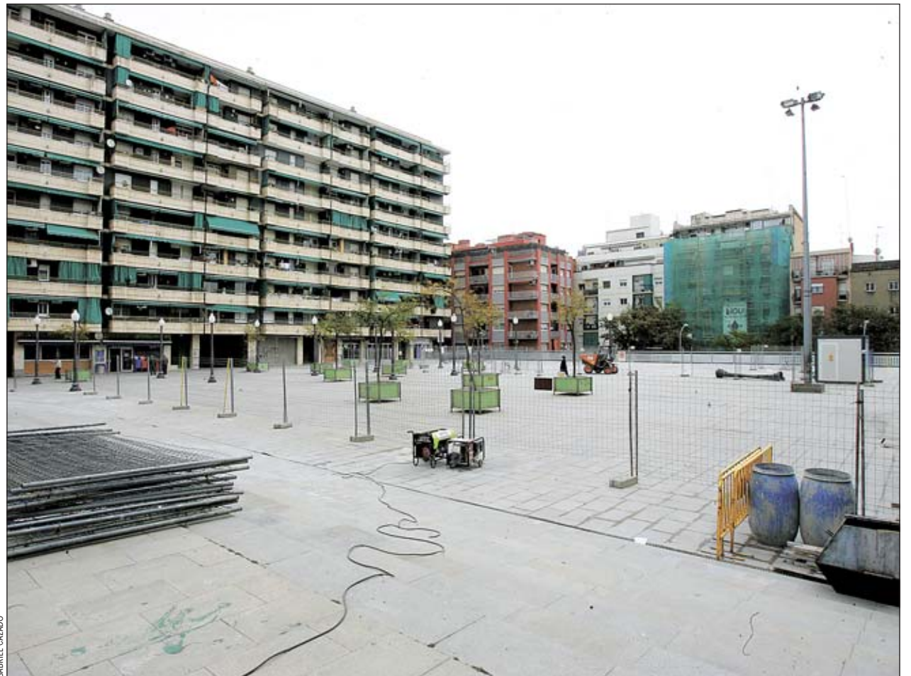
La solución a las filtraciones de agua pasa por levantar la superficie de la plaza

Las obras de remodelación de la plaza de la Llibertat se prolongarán hasta finales del próximo verano. "De momento, se ha renovado un tercio de la superficie de la pla-