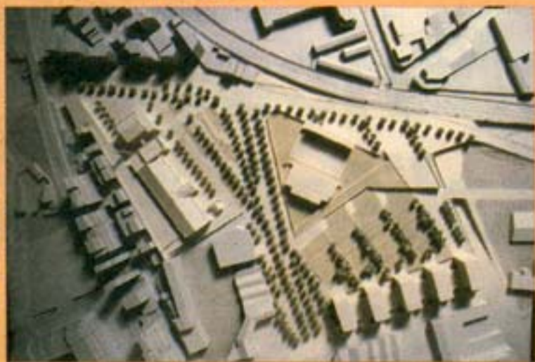
PERI Tecla Sala: Incluye el centro cultural insignia de la ciudad, el traslado del campo de fútbol y la reordenación de la zona

La nueva Gran Vía tendrá un diseño urbano, con señalización semafórica, sin bucles ni pasos elevados, con carriles laterales y una gran calzada central para la circulación separadas por paseos arbolados que permitan el cruce de las calles perpendiculares y los giros en todos los sentidos. La intersección entre la Gran Vía y los otros dos ejes viarios del 'Cuadrado Central', la calle Amadeo Torner y la Rambla de la Marina, se resuelve con dos rotondas. Para aumentar el volumen de tráfico que circulará por la nueva Gran Vía, y no perder capacidad a causa del ajardinamiento de medianas, se contempla desdoblarse el tráfico por las calles Ciències y Arquitectura. Otro de los aspectos fundamentales del proyecto es la remodelación de la plaza Cerdà, que debería suprimir sus niveles elevados para que la Gran Vía tenga un perfil longitudinal plano, y la reforma del nudo viario de Bellvitge que perderá importancia en favor del nudo del Llobregat de la Pata Sur.