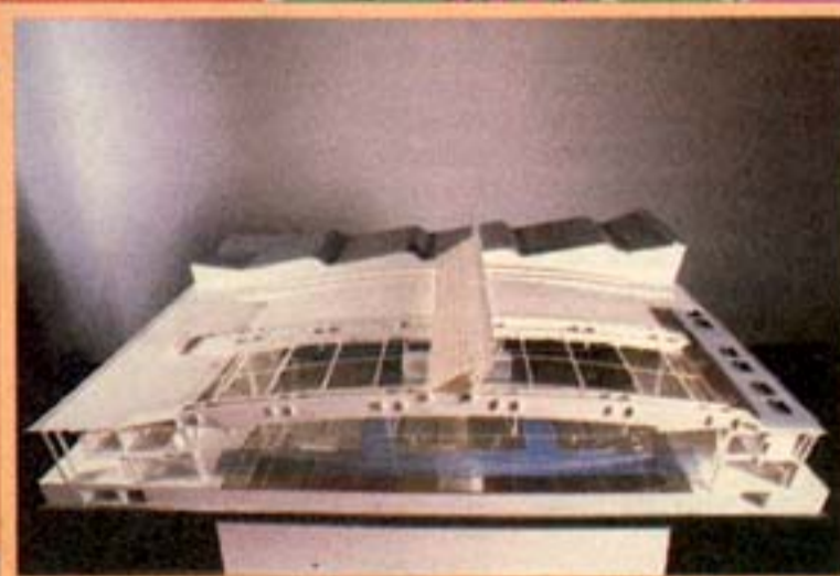
Montjuïc 2/L'Hospitalet: El recinto ferial y los sectores Pedrosa y Granvía Sur forman la principal zona económica del municipio

Se superará la vía del tren para vertebrar L'Hospitalet