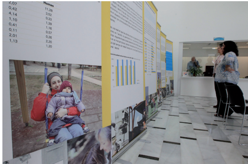
Exposició ubicada a la masia Can Colom fins al dia 25

Els serveis d'aquest programa es van traslladar al nou edifici a finals de juliol i han començat el curs amb la mostra Quin temps tenim? , oberta fins al 25 d'octubre, i diverses activitats relacionades en un cicle que porta per títol Tens un minut? L'exposició va ser inaugurada per la