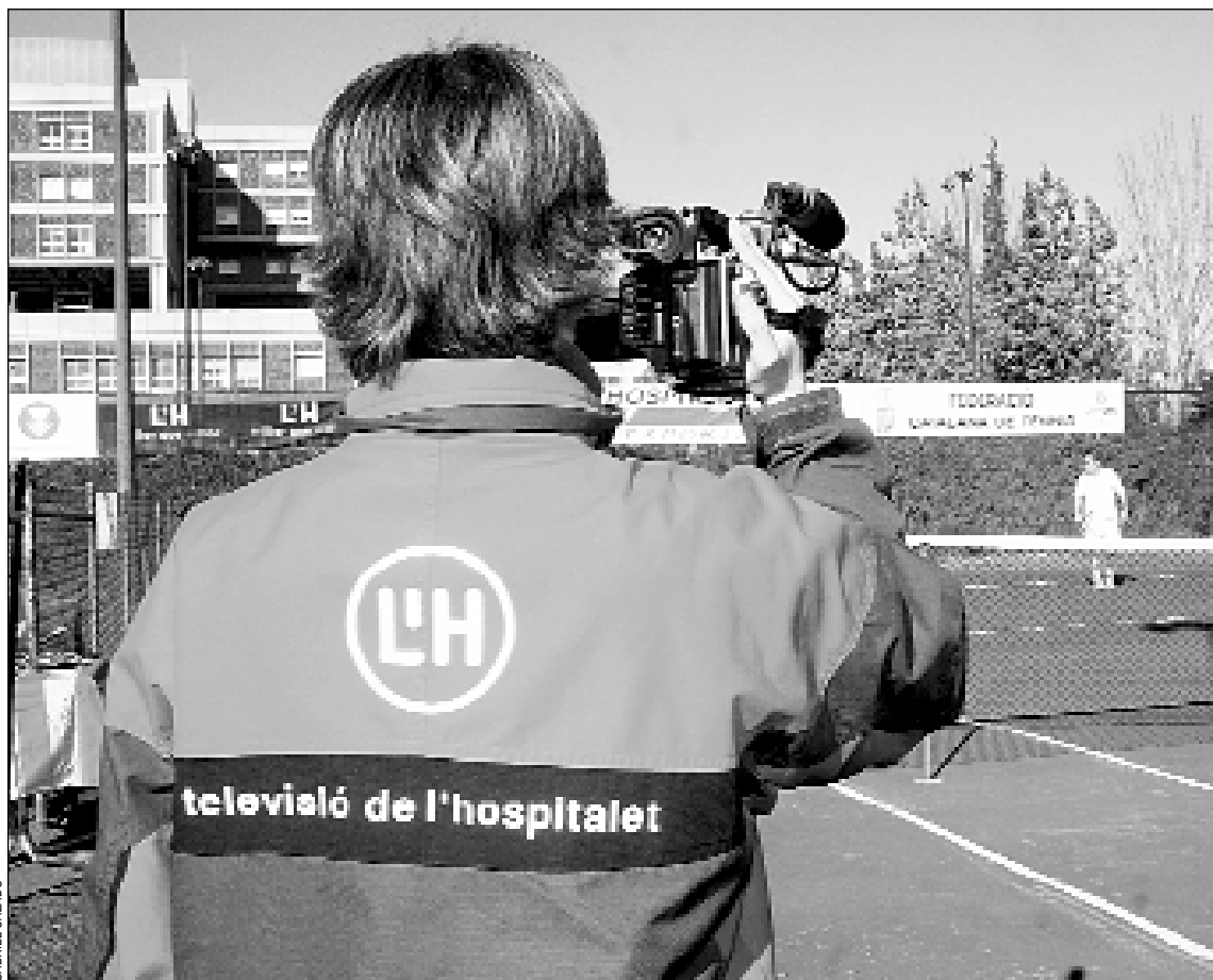
La programació de Televisió L'Hospitalet, ahora también por cable

Por otra parte, desde el pasado mes de enero, la Televisión de L'Hospitalet incluye en su programación deportiva de los lunes un completo resumen de la liga de fútbol de Segunda División B en la que milita el Centre d'Esports L'Hospitalet, gracias a un acuerdo de las emisoras que forman parte del Circuit de Televisions Locals de Catalunya.