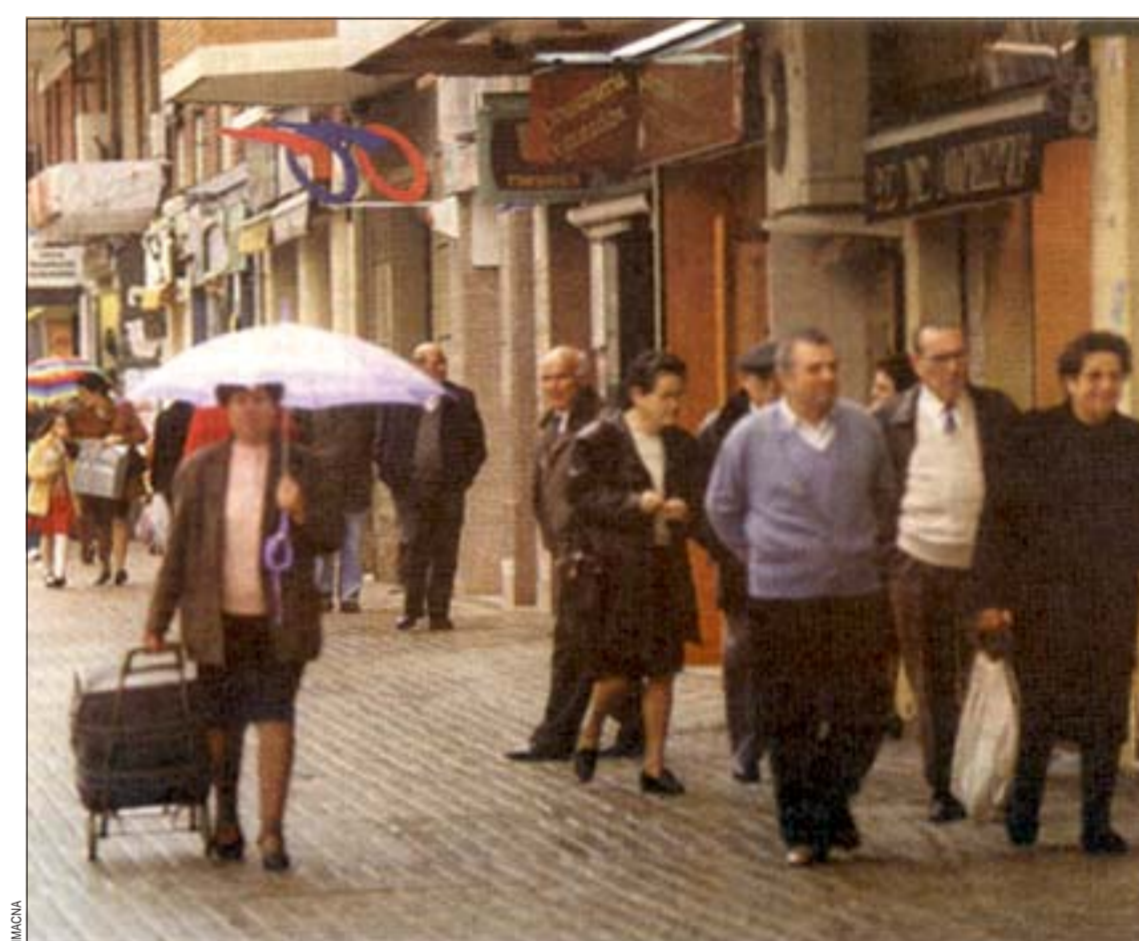
La actual oferta comercial de L'Hospitalet no puede absorber las demandas de la población

como una aproximación de la situación del comercio en Catalunya y no como una norma, que se revisará cada cuatro años, que determina el número exacto de me-